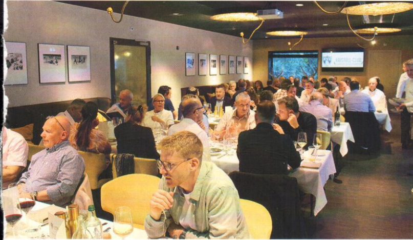
Stets gut besucht: Über 60 Mitglieder an der Kristall-Club GV im Legends Club.