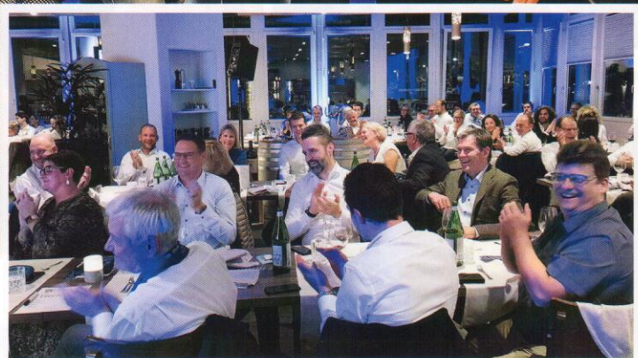
An der Crystal Night war das Restaurant Prisma ausgebucht.