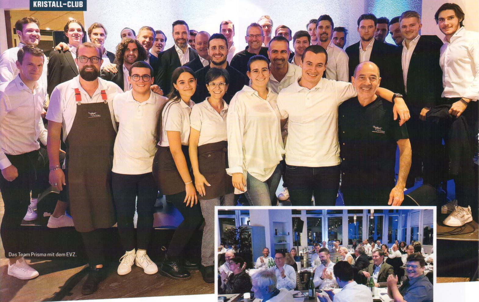
Das Team Prisma mit dem EVZ.