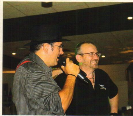
Eindrücke von der Notte italiana im Restaurant Prisma in Steinhausen.