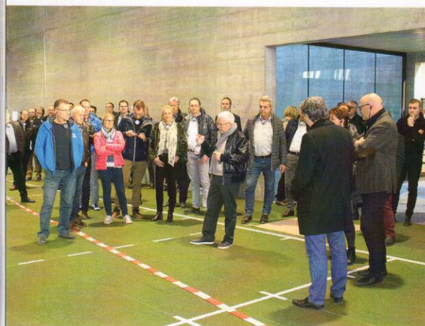
Auch die Kristall-Club-Mitglieder waren von der OYM-Führung begeistert.