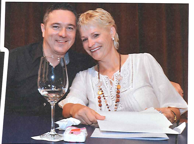
Impressionen von der Jubiläums-GV des EVZ-Kristall-Clubs.