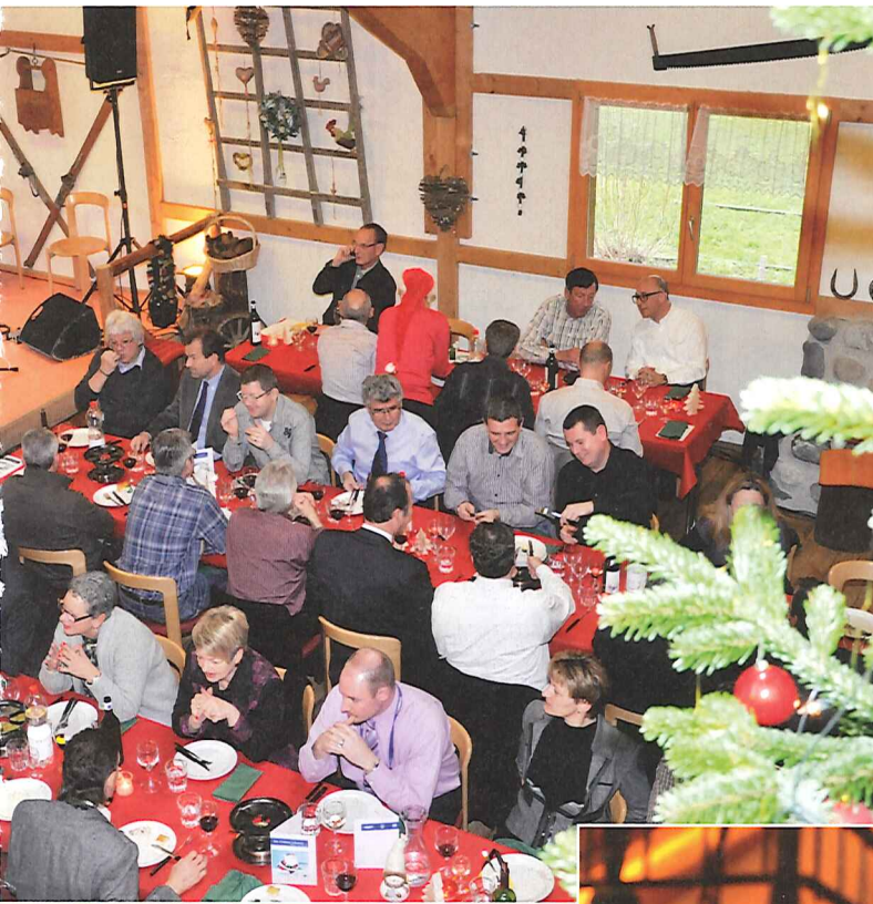
Impressionen vom Chlaus-Lunch in Allenwinden.